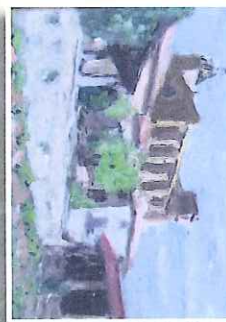
6 Eglise de Lardun 1944-1945