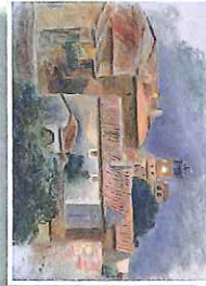
2 Peinture d'Auguste Renoir Vue de Lardun depuis la maison d'Albert André 1904