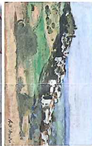
Vue générale de Lardun 1945