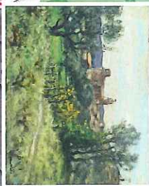
Lardun vu de Piedalhan 1946