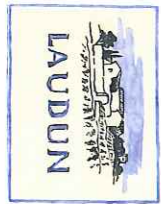
Projets d'étiquettes pour les vins de Lardun vers 1951