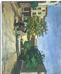
8 Rue de Lardun La caussette 1949