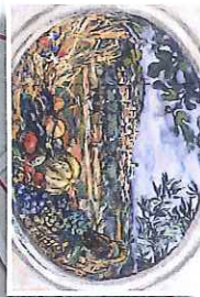
Décoration ovale - Lardun 1942