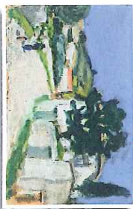
Le grand chemin à Lardun 1950