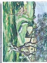
10 La maison Gazagne au printemps 1940