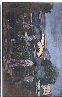
14 Les vendanges 1902