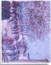
5 La place de Lardun le dimanche 1942