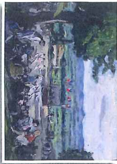
3 La farandole à Lardun 1947