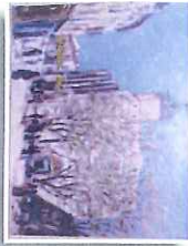
4 L'église et la place de Lardun au printemps 1944