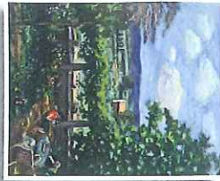
1 Au jardin 1951