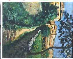
Chemin montant à Lardun 1942