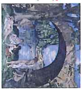
Les baigneuses sous un port 1908